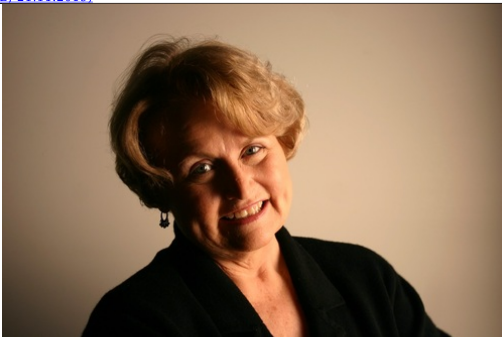
Zdjecie z konferencji