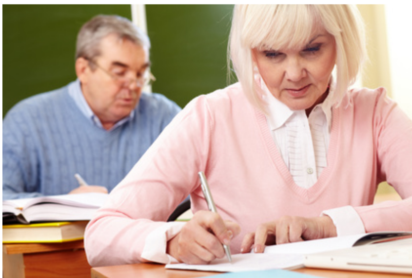
Zdjecie z konferencji